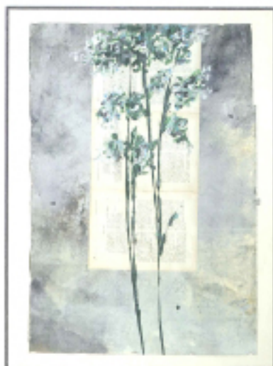
Fiori Immaginari Fiori Coolam Sky Flower