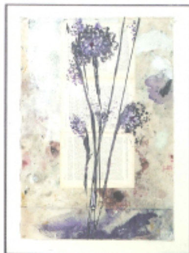
Fiori Immaginari Fiori Amore Love Flower