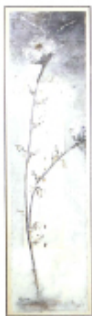
Flora di memoria Flora della memoria (Flower of Memory)