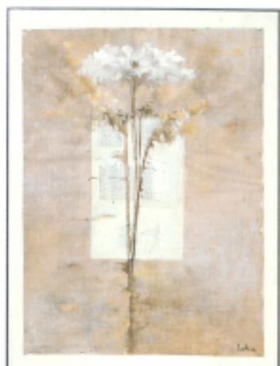
Fiori Immaginari Fiori Panna Panna Flower

義大利為歐洲文化思想的根源地之一，古羅馬的光榮與文藝復興的璀璨都在這塊土地上孕育而生，藝術家布列妮塔·羅賽迪 (Brigitta Rossetti) 深受義大利詩歌、哲學的啟發，尤其受羅馬共和國詩人兼哲學家提圖斯盧克萊修 (Titus Lucretius) 的著作《物性論 (De Rerum Natura)》影響至深。如同杜象 (Marcel Duchamp, 1887-1968) 及沃荷 (Andy Warhol, 1928-1987) 大量使用「現成品」進行藝術創作，布列妮塔同樣將大師的書籍、詩歌、樂譜、著作和諧地與自己的標誌主題「花卉」精彩融合，搭配由金屬鑲件所製成的特殊裝裱以及展示時呈現的燈光，企圖將二維空間的平面繪畫融入複合媒材，並且延伸至三維立體裝置，經過概念的轉換，以講究及刻意設計的擺放方式呈現出作品、空間及觀者三者微妙關係。