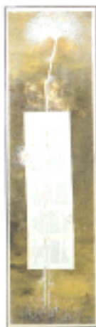
Flora di costui Flora dell'amore gentile (Flower of the Gentle Love)