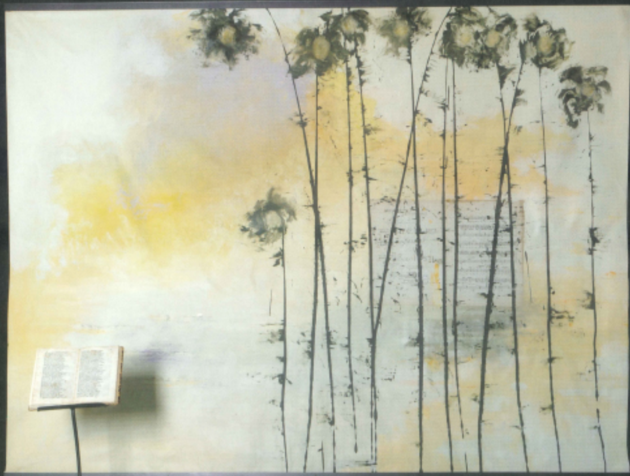
Standing Flower Compositore solista, flautista, rullino and orchestra conductor